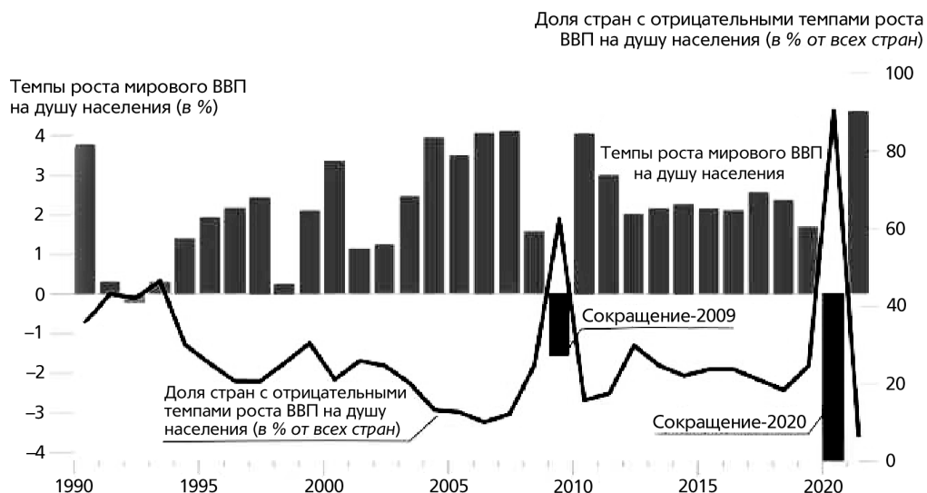
Рис. 1. Темпы роста мирового ВВП на душу населения и рецессии в период с 1990 по 2021 г.

Примечания. Левая шкала (столбчатая диаграмма) – темпы роста мирового ВВП на душу населения (в %); правая шкала (линейный график) – доля стран с отрицательными темпами роста ВВП на душу населения (в % от всех стран).