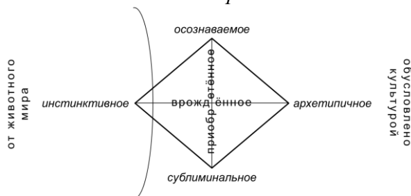
Рис. 1 Базовые психологические понятия

Оперативная цель (основная задача) исследования – определить и структурировать механистические факторы управленческой эффективности на базе глубинных психических категорий .