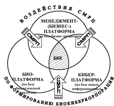
Рис. 1 Образование биокиберкорпорации: / Formation of biocybercorporation/

Отмеченные работы и работы [5-7] подготовили почву для формирования «полнокровной» обучающейся организации новой формации, базирующейся на трех платформах: менеджмент-, кибер- и био-платформе. Такая организация может быть названа биокиберкорпорацией и ее обобщенная схема, представлена на рис. 1. [8,9], (см. рис. № 1).