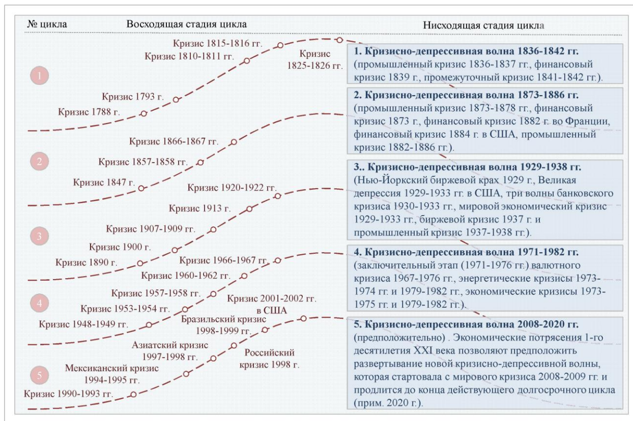
Рис. 1 Экономические кризисы на различных стадиях долгосрочного цикла / Economic crises at various stages of the long-term economic cycle

собой действенный способ исследования природы экономических явлений, позволяющий правильно уяснить сущность событий, включенных в общий циклический процесс.